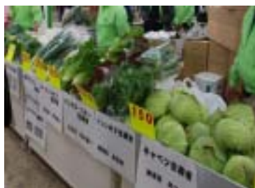
新鮮！安全安心！ 東京産農産物