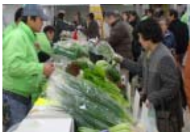
農畜産物を 買い求めるお客さん