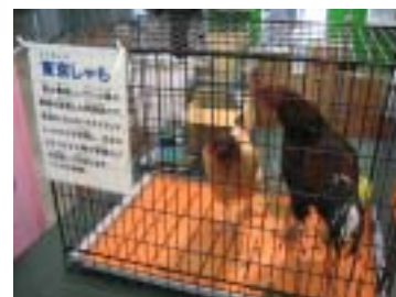
「東京しゃも」の展示